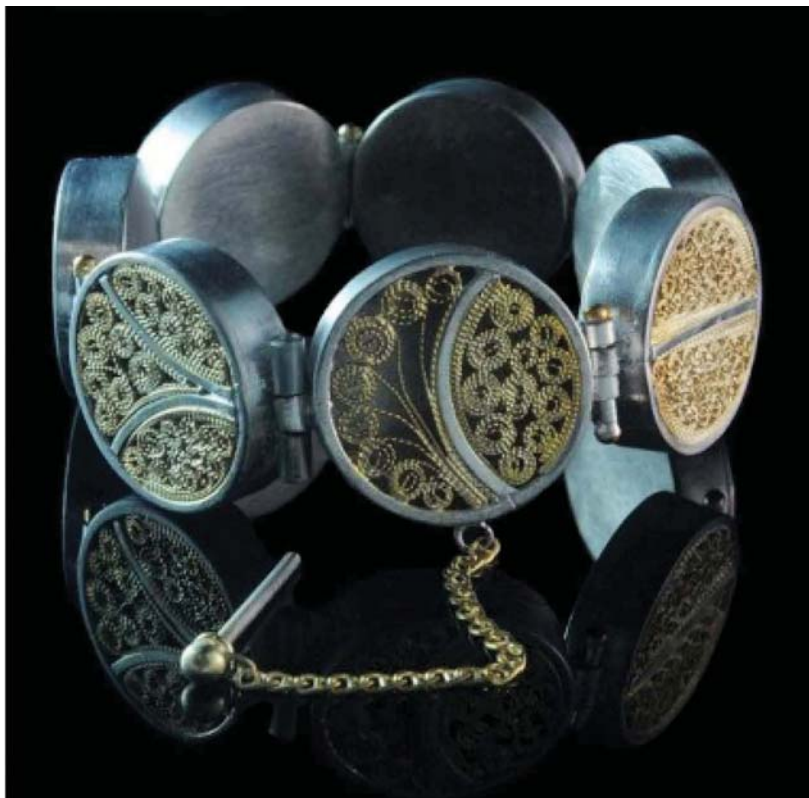
Vòng tay filigree, sản phẩm của ANGSA (Thái Lan) -

Nguồn: http://www.handmade-chiangmai.com/monthly_highlights/pages/3