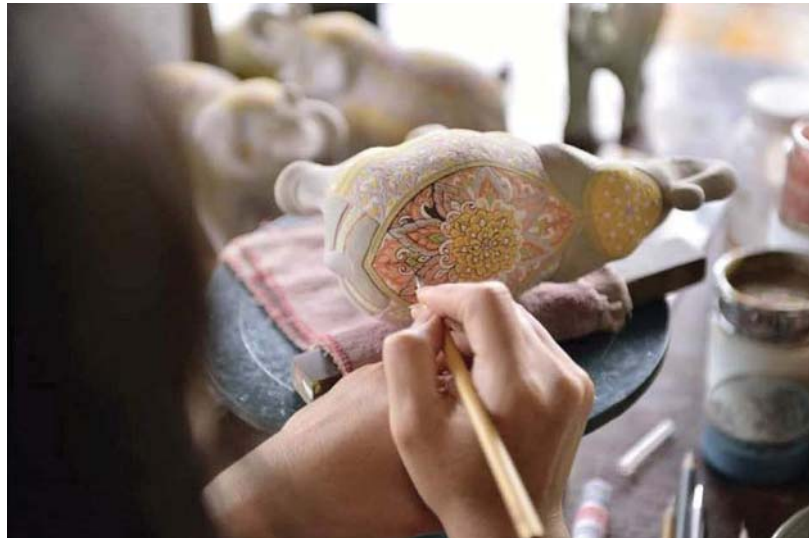
Du khách thực hành vẽ hoa văn trên gốm

Bản đồ trên biểu thị mức độ tập trung của các địa điểm, đơn vị, tổ chức, cộng đồng liên quan tới sản xuất, thiết kế, sáng tạo, đào tạo, quảng bá, quản lý và kinh doanh các loại hình thủ công truyền thống và thủ công đương đại của Chiang Mai. Từ Bản đồ sáng tạo Chiang Mai (Chiang Mai Creative Mapping), bất kỳ ai cũng có thể tiếp cận được hồ sơ thông tin chi tiết của các địa điểm trên nhằm phục vụ cho các mục đích khác nhau về du lịch, đào tạo, đầu tư,... Qua bản đồ này, có thể tiếp cận chi tiết hơn nữa về toàn bộ các hoạt động liên quan tới thủ công mỹ nghệ của tỉnh hiện nay trên website của dự án Handmade - Chiangmai: http://www.handmade-chiangmai.com . Đây không chỉ đơn thuần là một website quảng bá, mà thực chất, Handmade - Chiangmai là một "cửa hàng bách hóa" - một kho dữ liệu cơ sở - mà ở đó, người dân, du khách, các nhà quản lý, các nhà nghiên cứu, doanh nghiệp có thể dễ dàng tiếp cận và tìm hiểu về các sản phẩm thủ công mỹ nghệ truyền thống và đương đại của các nghệ nhân, các làng nghề và cộng đồng và đặc biệt là các doanh nghiệp, tổ chức ở các lĩnh vực, như: mây tre đan, hạt, kim loại (trang sức), gốm sứ, làm giấy, dệt, đồ gỗ, xà phòng và dầu, dưới dạng hình ảnh, video, các câu chuyện, thông tin cơ sở, bản đồ tương tác, các khóa học, danh mục và các thông tin hữu ích khác. Về cơ bản, đây là kết